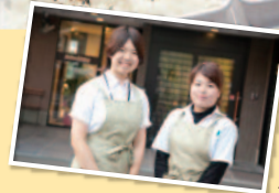
調理担当の管理栄養士

“リハビリング神戸西”は、伊川のせせらぎが聞こえ、目の前は公園という立地。周辺には医療センタービルやコンビニエンスストア等、生活便利施設が充実。電車・車で三宮へのアクセスも便利です。