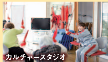
カルチャースタジオ

運動指導をはじめ囲碁、将棋、アロマテラピー、フラワーアレンジメント、園芸などの教室を開催